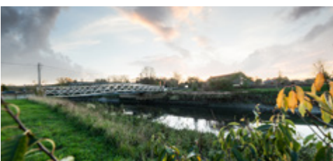
De Zennebrug in Leest