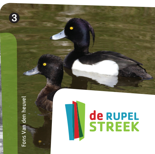
Fons Van den heuvel